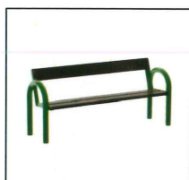
5. Ławka z oparciem