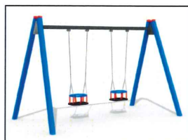
4. Huśtawka dla malucha