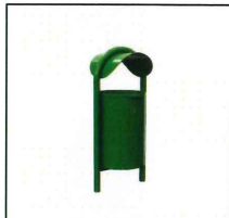
6. Kosz na śmieci