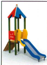
7. Zjeżdżalnia dla malucha