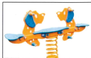
1. Kiwaczki dla dwojga