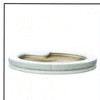
3. Okrągła piaskownica