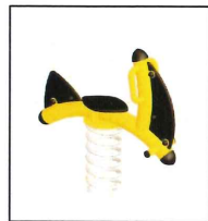
2. Kiwaczek jacht